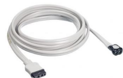
Воздушный шланг для взрослых/ педиатрических манжет 2058203-002