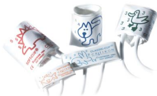
Манжета 3-6 см № 1 Манжета 4-8 см № 2 Манжета 6-11 см № 3 Манжета 7-13 см № 4 Манжета 8-15 см № 5