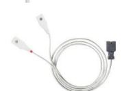
Датчик универсальный LNCS Y-I