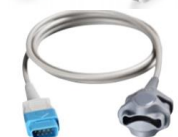
Мягкий датчик для детей TS-SP-D