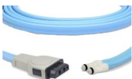
Воздушный шланг для неонатальных манжет 2058204-003