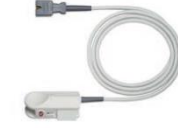
Пальцевой датчик для детей LNCS DCI-P