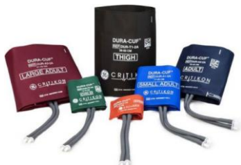
Младенческая манжета 8-13 см Детская манжета 12-19 см Взрослая малая 17-25 см Взрослая манжета 23-33 см Взрослая большая 31-40 см Набедренная манжета 38-50 см